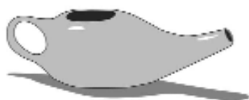
Ryc. 1. Dzbanek neti

Osoby początkujące mogą współczesny zabieg džalaneti wykonywać przy użyciu naczynia z dziobkiem, najlepiej o gładkich brzegach, nazywanego neti-pot (dzbanek neti ) ( ryc. 1 ). Głowę należy przechylić w bok i trochę w dół, wprowadzić dziobek naczynia do otworu jamy nosa położonego przy tej pozycji wyżej, a następnie otworzyć usta i oddychać przez nie tak długo, aż woda zostanie zaaspirowana do jamy nosa, aby po chwili wypłynąć częściowo przez drugie nozdrze, a częściowo przez usta. Tę część się wypłukuje. Zabieg powtarza się, przechylając głowę w drugą stronę i wprowadzając wodę do drugiego otworu nosowego.