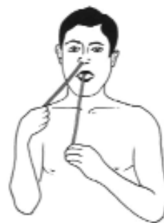
Ryc. 2. Technika zabiegu sutraneti kapālabhāti , czyli oczyszczanie jamy nosa i zatok przynosowych powietrzem przy użyciu odpowiedniej techniki oddychania, jogini wykonywali jako trzeci i ostatni zabieg.

Od czasu rewolucji przemysłowej w XIX wieku środowisko człowieka ulega coraz większemu zanieczyszczeniu. Do atmosfery